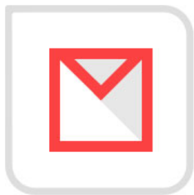
通过账号和邮箱 找回密码