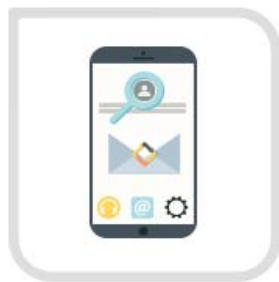
通过账号和手机验证码 找回密码